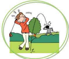
ゴルフ中の賠償事故