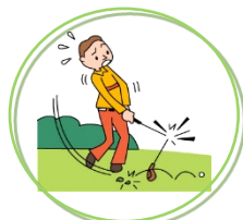
ゴルフクラブの破損